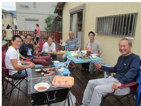
バーベキュー交流会の様子

地域のパパたちが中心となって、講演会、バーベキュー交流会、お餅つき会、スポーツ大会など、家族で参加できる行事や交流会を開催しています。仕事や世代も違うけれど、子育てがテーマに集まったパパたちは皆仲間です。お気軽にご参加ください。お待ちしております。